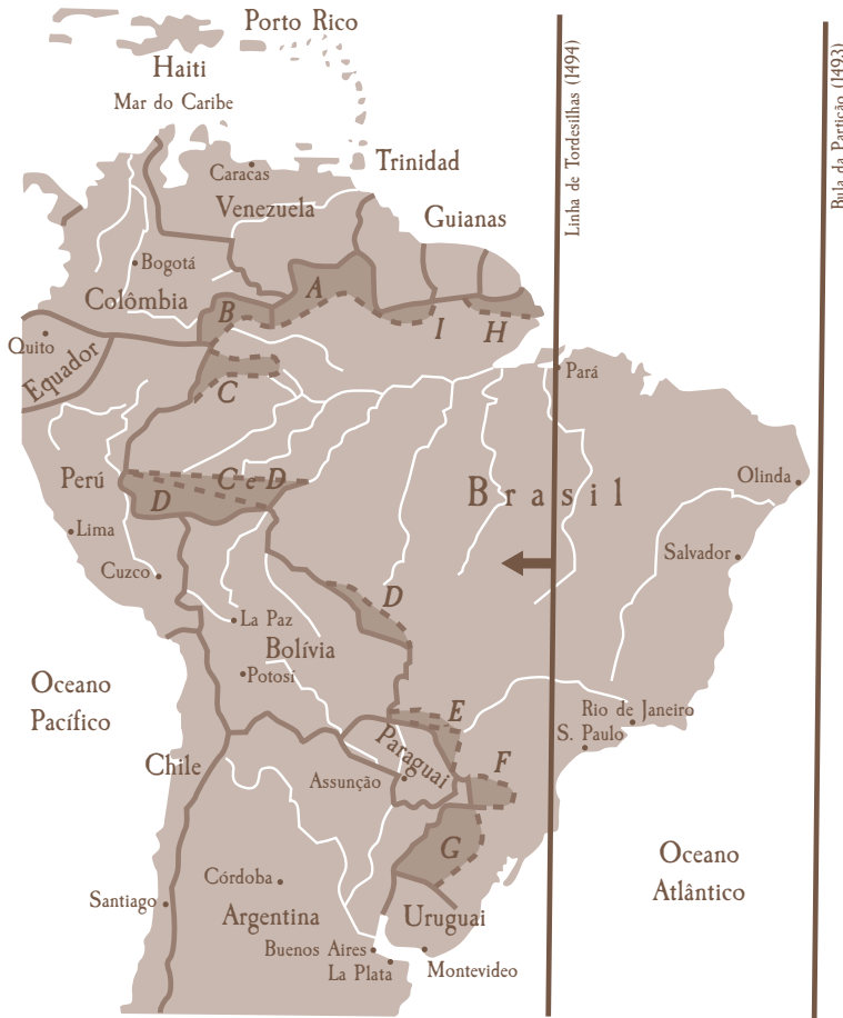
Mapa 16, A "expansão" do Brasil