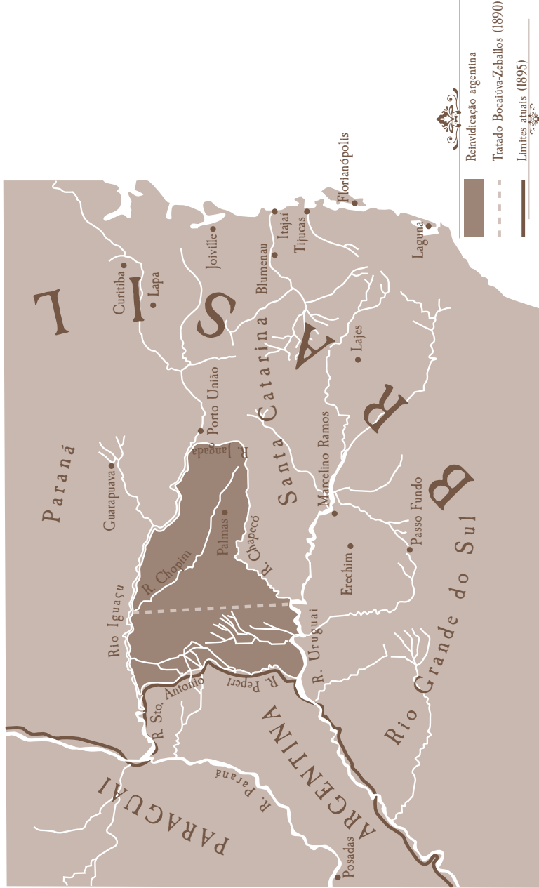
Mapa II. O arbitramento de 1895