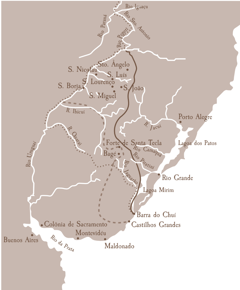
Mapa 9. Variações da fronteira sul