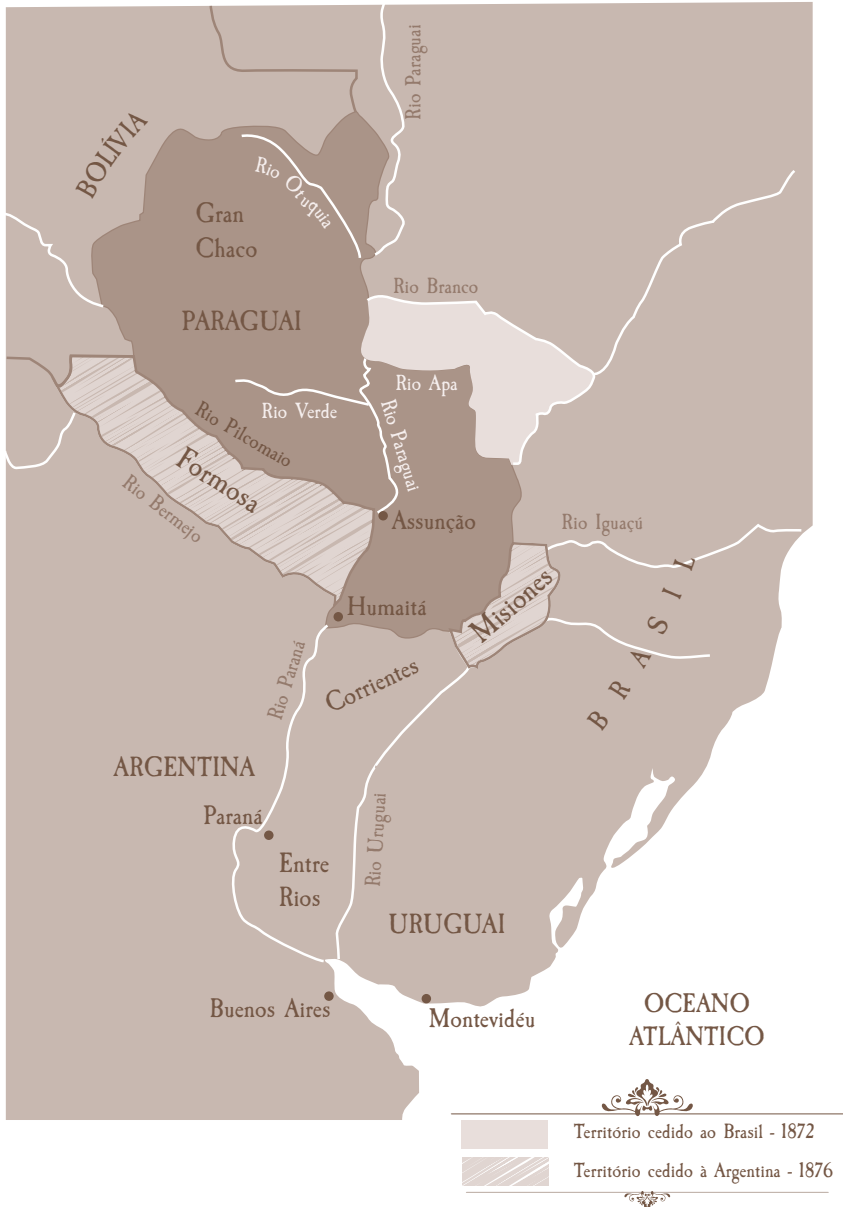
Mapa 10. Limites do Paraguai após a Guerra