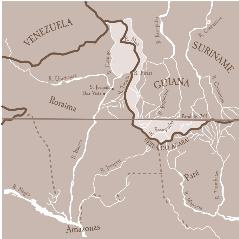
Mapa 13. O arbitramento de 1904