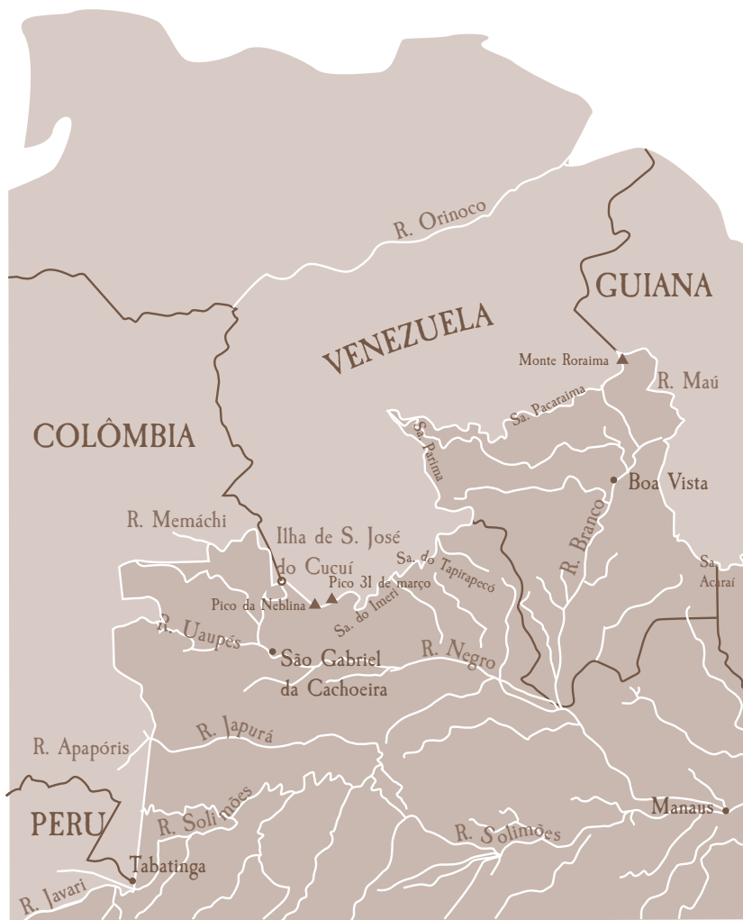
Mapa 15. A fronteira noroeste